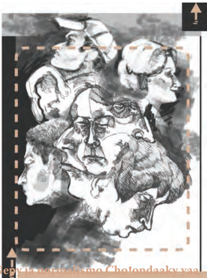
Nepy ja normalismo Cho'ondaaky yaa

Ja Te'em Kyop'ajpĕ mĕdu'untyĕ Mĕj kapxta'agyĕĕbĕ kĕxyĕn ma yĕ'ĕ Yajkapxta'agyĕĕbĕ ajxy Ñĕgapxtaagĕ'ĕyĕn alvaro.lopez@sep.gob.mx